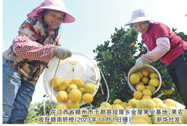
在江西省赣州市于都县段屋乡金屋果业基地,果农收获赣南脐橙(2023年11月1日摄)。