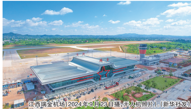
江西瑞金机场(2024年9月23日摄,无人机照片)。