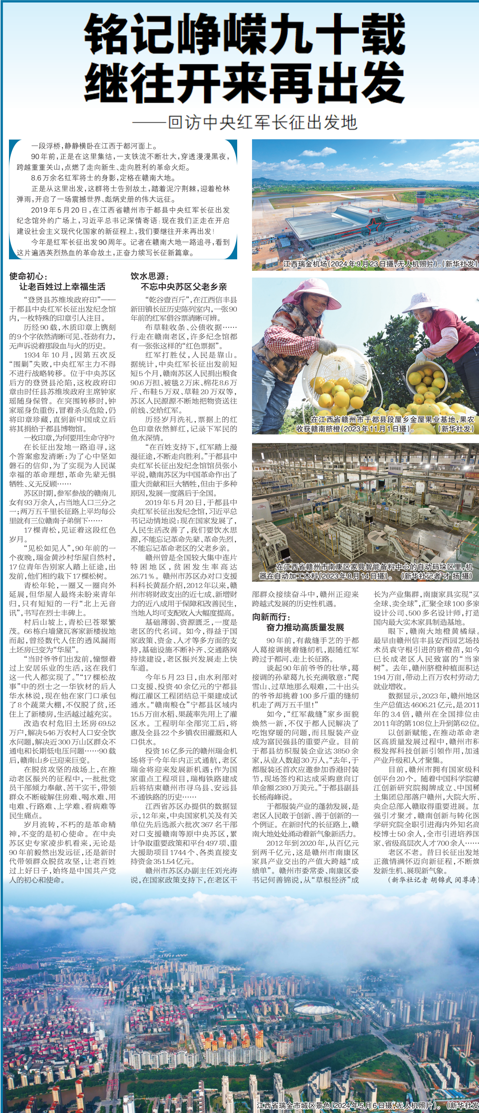
江西省瑞金市城区景色(2024年5月6日摄,无人机照片)。

续犯下“罪行”负有完全责任。近日以军对加沙地带北部的密集攻击仍在继续。联合国近东巴勒斯坦难民救济和工程处主任专员菲利普·拉扎里尼19日在社交媒体上表示,18日又有2万人被迫逃离加沙地带北部杰巴利耶难民营。加沙地带北部地区遭遇大范围通信和网络中断,多家医院燃油和医疗用品严重短缺。