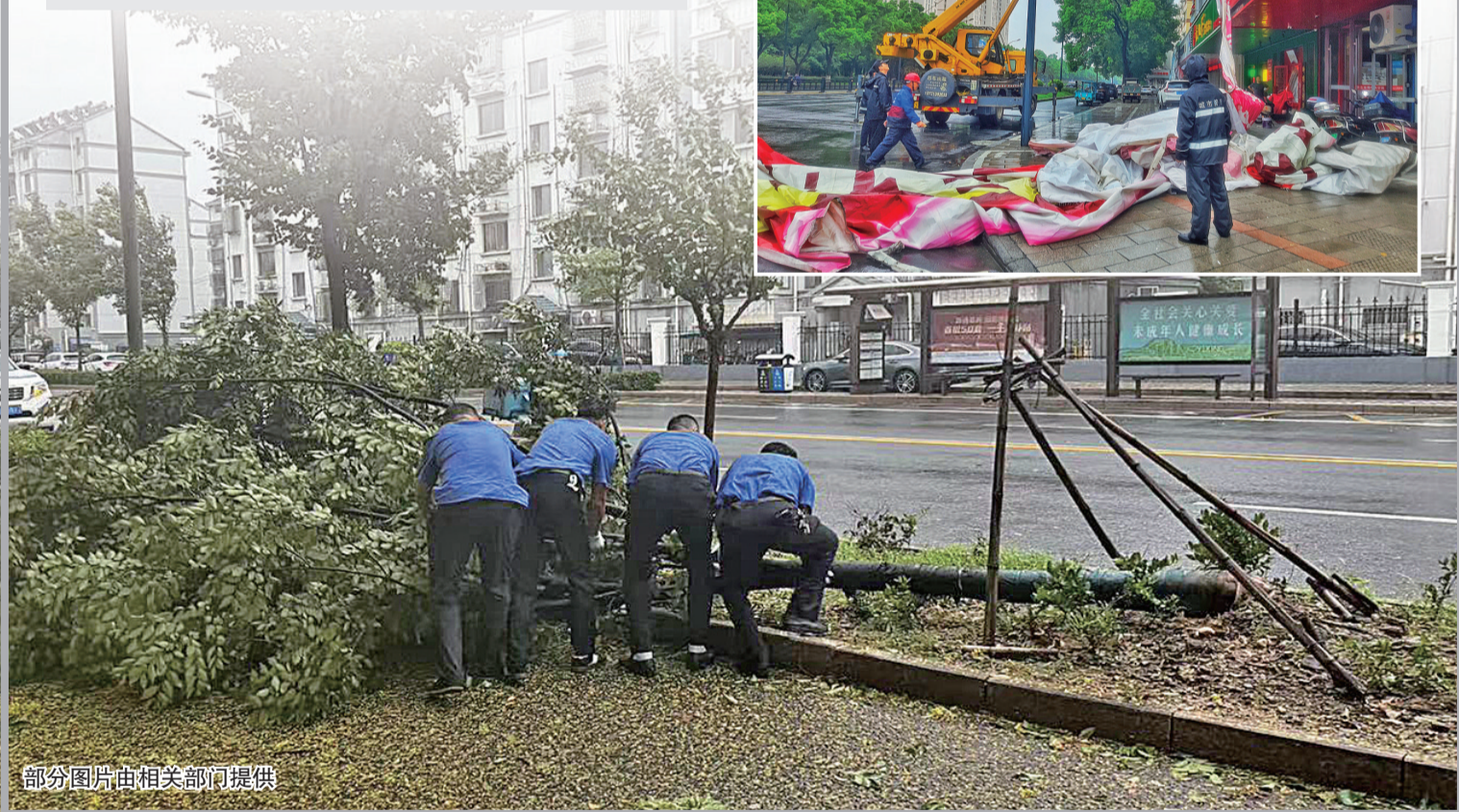
部分图片由相关部门提供