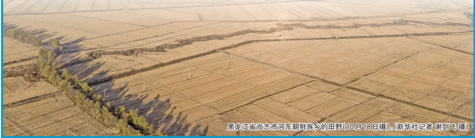
黑龙江省尚志市河东朝鲜族乡的田野(10月18日摄)。

国家统计局12月11日发布数据显示,2023年全年粮食产量再创历史新高,粮食总产量连续9年稳定在1.3万亿斤以上。这是属于亿万农民的丰收,是属于14亿中国人的丰收,是党的重农强农政策的丰收。 把牢“米袋子”,拎稳“菜篮子”,靠的是重农强农政策“先手棋”。2022年底,中央经济工作会议、中央农村工作会议对实施新一轮千亿斤粮食产能提升行动,保障粮食和重要农产品稳定安全供给等做出全面部署。今年春节刚过,中央又及时做出部